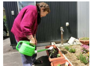
毎日かかさず水やりしています!!