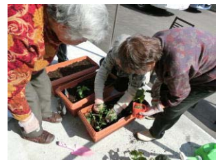
野菜の苗を植えて…