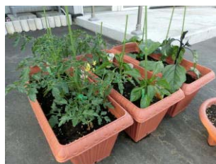
だんだん大きくなり、トマトは花が咲きました!!