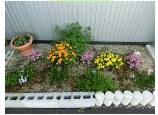
花壇のお花もきれいに咲いてきました♪