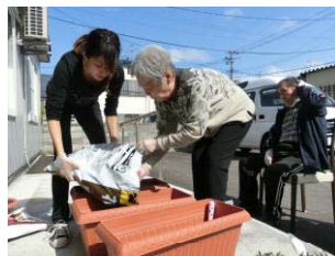
プランターに土を入れ…

沢庵の花壇は4月に植えた花が咲いたり、芽を出したりと、だんだん華やかになってきました!!5月は田植えや野菜などの苗を植える時期なので、沢庵でもミニトマト、キュウリ、ナス、パプリカの苗を植えて育てることにしました。天気が良い日に外へ出て、皆で植えましたよ♪